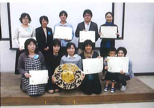
第7回報告会での受賞者のみなさん