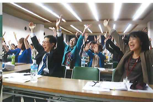
笑いヨガにも挑戦しました