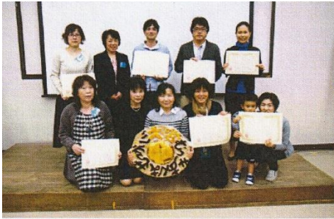
第7回報告会での受賞者のみなさん