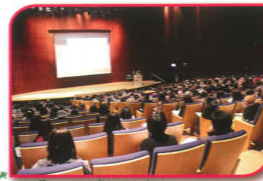
看護・介護関係者+一般の方々