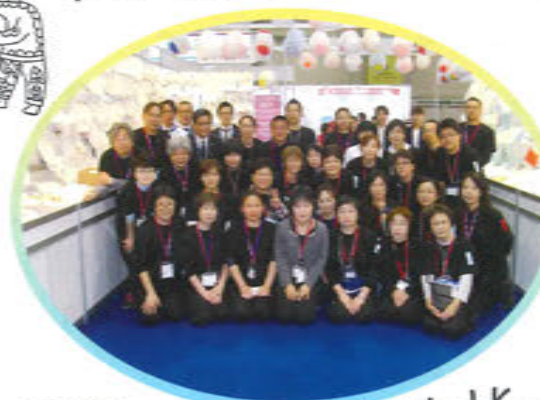
お手伝いしてくださった皆さん、ありがとうございました