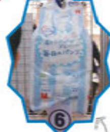
第2位 エルミア いちばん (カシ商事さん)