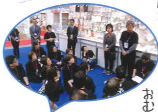
いよいよ始まります。全員集合!