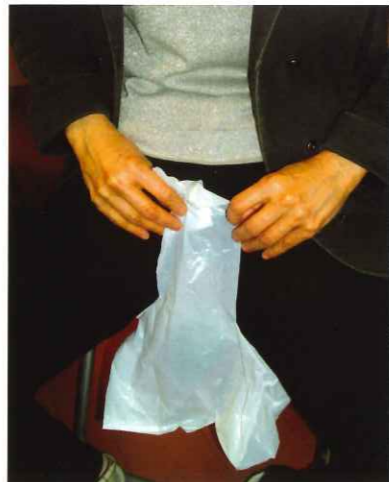
☆切った部分が尿モレを防ぎます