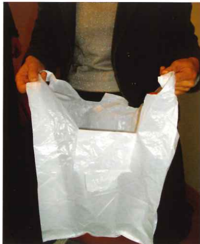
☆前を少し切ります